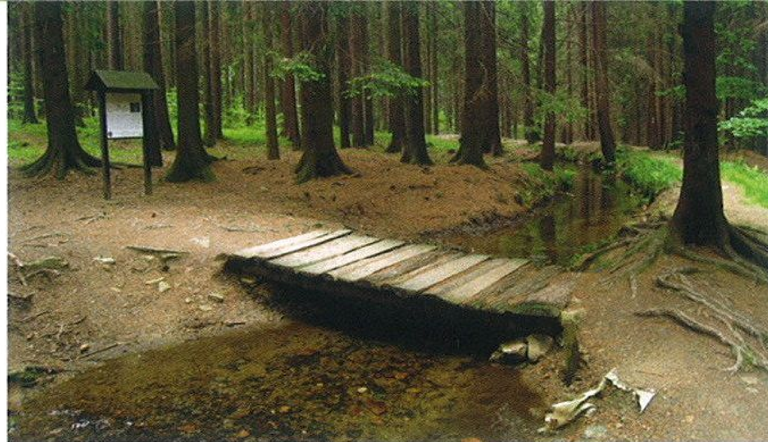
Neubráníte se dojmu, že středověký náhon teče do kopce

stoupa či pucherna) na hrubé drcení vytěženého materiálu, spodní část roztáčejí mlýnské kameny, kde se propaná ruda drtila na prášek k dalšímu prosívání. Zákoutí s klapajícími mlýny a zurčícím náhonem uprostřed lesa působí jako zjevení opravdu z jiného století. Rýžování si můžete v připravených žlebach sami vyzkoušet a kdo rád sportovní zápolení, může údolí navštívit v době věhlasných závodů v rýžování zlata, které se tady konají již několik let.