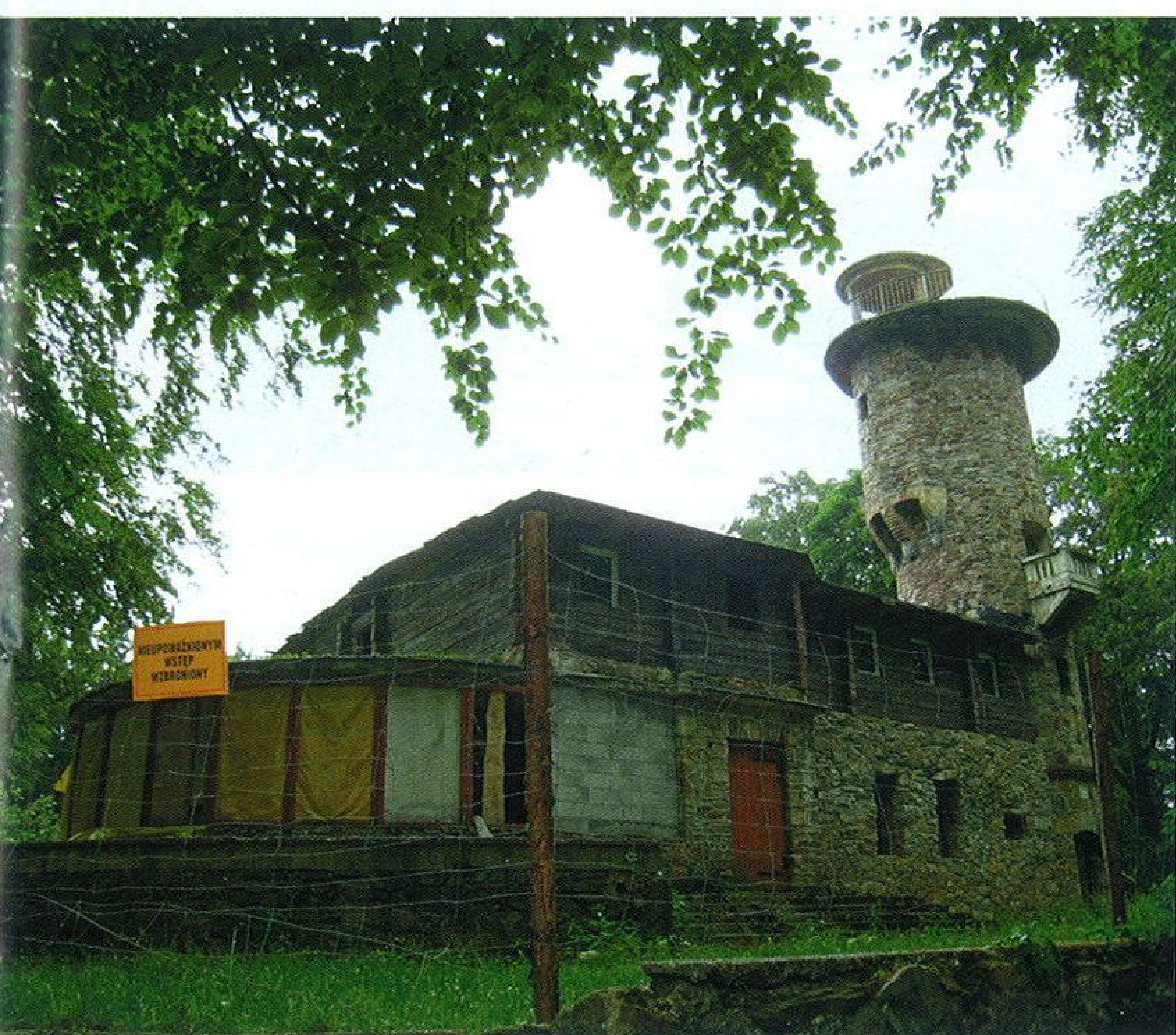
Hohenzollernwarte čeká buď neblahý konec, nebo generální rekonstrukce

teče do kopce. V duchu smekáme helmu před dávnými staviteli, kteří, nemaje vrstevnicové mapy ani nivelační přístroje, toto dílo tak umně zbudovali. Ve svahu pod úrovní kanálu tušíme v lese stopy po dávné těžbě – pinky, obvaly, odvaly a další relikty. Kdo nemá tuto terminologii v malíku, tomu poslouží četné informační tabule naučné stezky Údolí ztracených štol, po které právě jedeme. Hlavním lákadlem údolí jsou dvě repliky dřevěných vodních „zlatorudných“ mlýnů. Jsou vystavěny v kaskádě nad sebou, přičemž horní je tzv. stupník (aneb