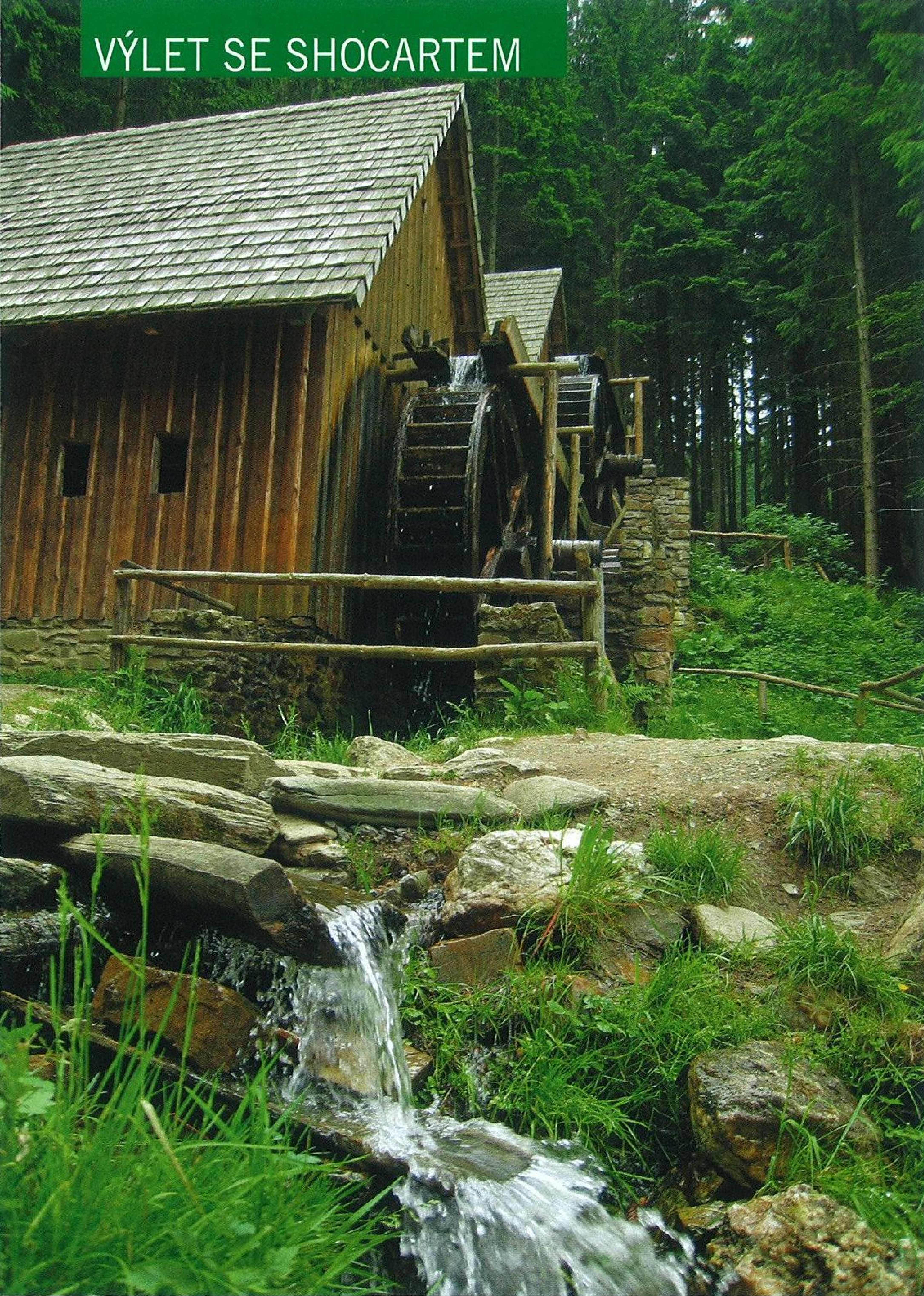
U replik zlatorudných mlýnů jako by se zastavil čas